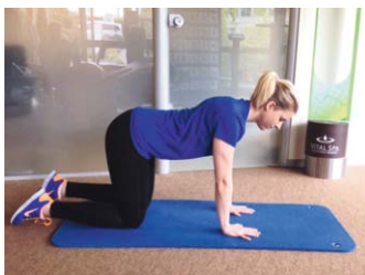
Ausgangsstellung: „Katze mit gesenktem Rücken“

Haupt-Wirkung: Mobilisation der gesamten Wirbelsäule Neben-Wirkung: sanftes Kräftigen der Arm-, Schulter- und Brustmuskulatur