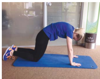
„Katze mit rundem Rücken“